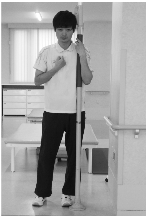
図2. 介入2期の立位保持姿勢

今回の研究発表については，その目的と内容について説明した後，家族に書面及び口頭にて許可を得た。