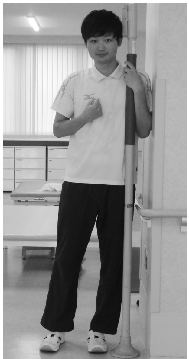
図1. 介入1期の立位保持姿勢

ベースライン期では、非麻痺側に重心を十分に寄せることが出来ず、麻痺側に荷重してしまい、麻痺側の膝折れや体幹が後方や前方に崩れていた。症例にとって垂直棒把持による立位保持は難易度が高いものと考えられたため、新たな介入として垂直棒に加えて、壁に寄りかかることを姿勢保持の手掛かり刺激として利用した（図1：介入1期）。介入は1日3回とし、90秒間の立位保持が成功した場合には即時的に称賛した。また、前回より介助数が減少した場合には練習後に称賛を行った。90秒間の立位保持を介助無しで1日3回連続成功したところで、壁