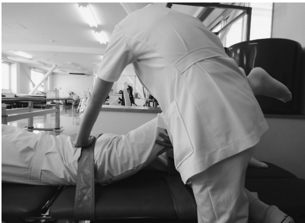
図1 股関節伸展ストレッチ方法

疼痛の無い範囲で対象者の反対側股関節を最大伸展させ30秒保持。その後，再度30秒静的ストレッチを実施。