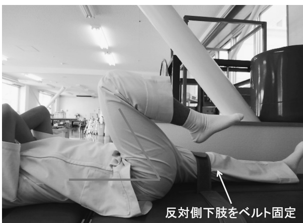
図2 股関節自動屈曲可動域測定

疼痛の無い範囲で対象者の反対側股関節を最大伸展させ30秒保持。その後，再度30秒静的ストレッチを実施。